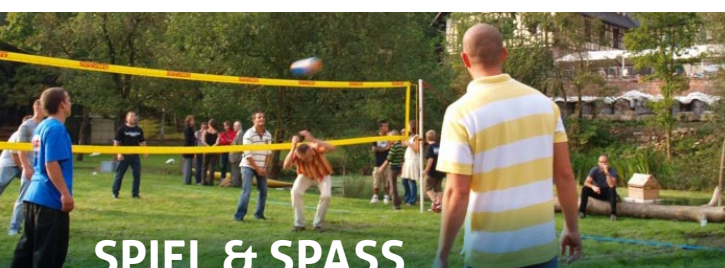
SPIEL & SPASS