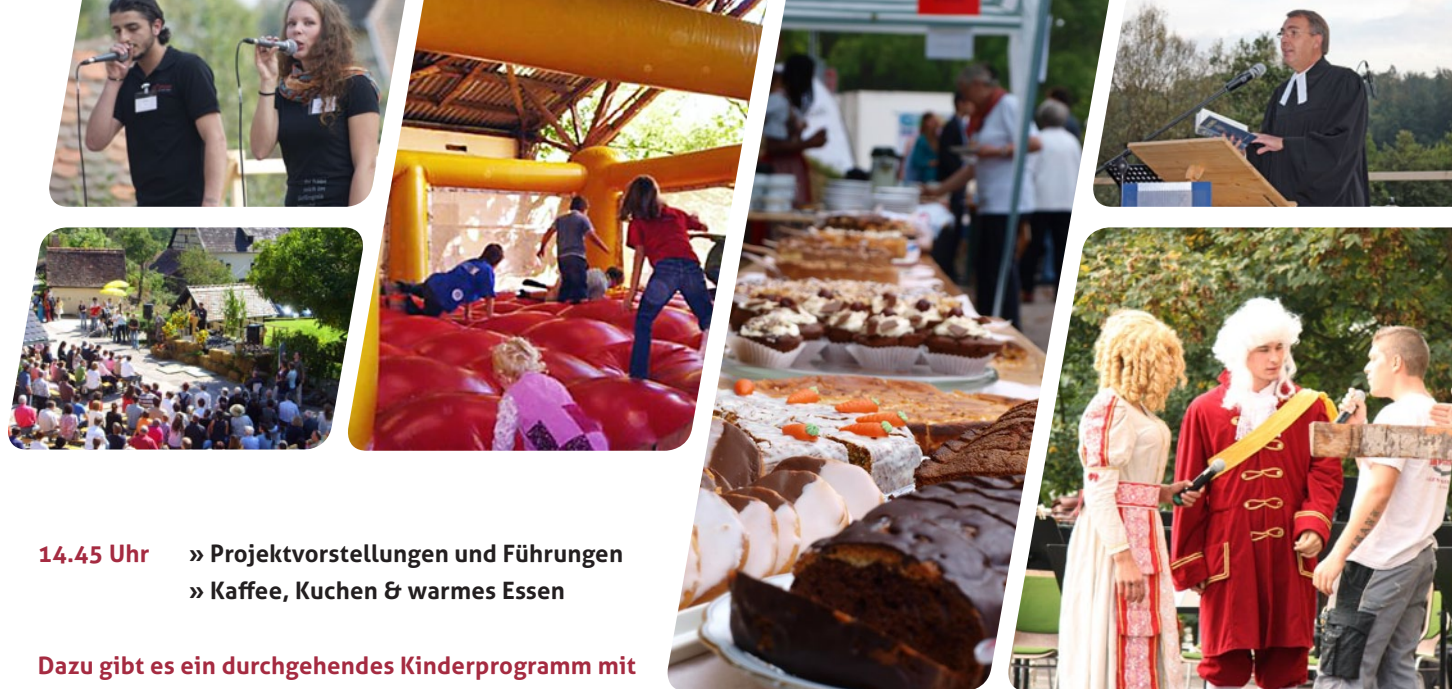
Eindrücke aus den letzten Jahren

www.seehaus-ev.de www.waldkindergarten-seehaus.de